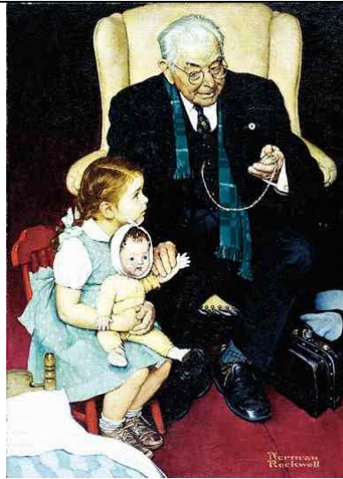
Lámina 5: "A Boneca Doente" del pintor Normal Rockwell (1894-1978)