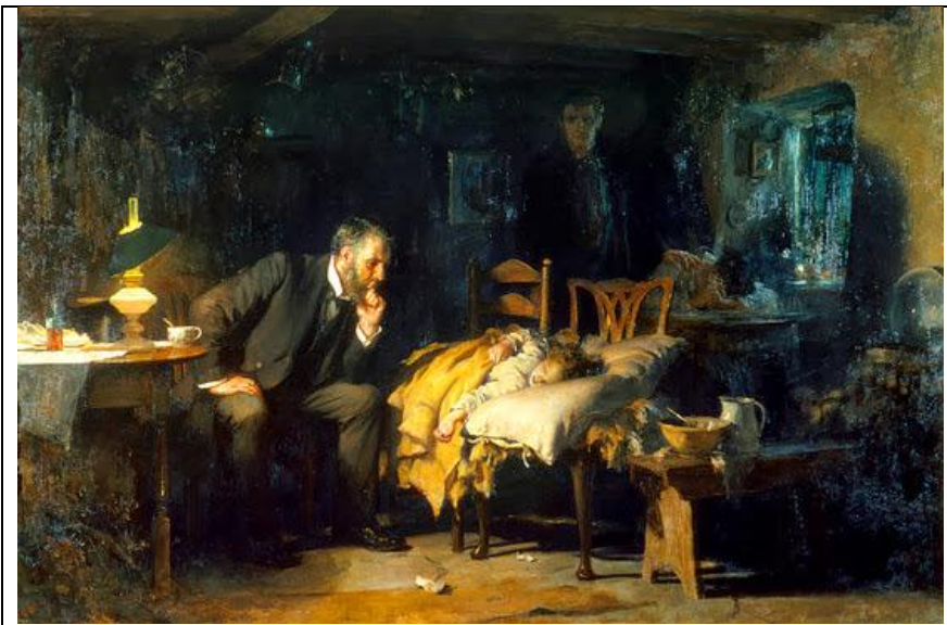
Lámina 1: "El Doctor", de Luke Fildes (1891) de Tate Britain

En la lámina 1, se ilustra la obra "El Doctor", de Luke Fildes (1891) de Tate Britain, que afirmó que su objetivo fue: "poner al médico en la posición que merece" casi como un "héroe trabajando al servicio de la humanidad y en una misión de piedad en lugares de gran pobreza".