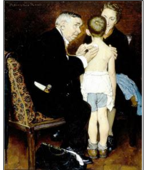
Lámina 6: "Médico e Jovem Paciente" del pintor Norman Rockwell (1894-1978)

En las pinturas de las láminas 4, 5 y 6 se revela la importancia del examen físico, particularmente de la auscultación, como segunda etapa del método clínico: indagación de información mediante el interrogatorio y el examen físico.