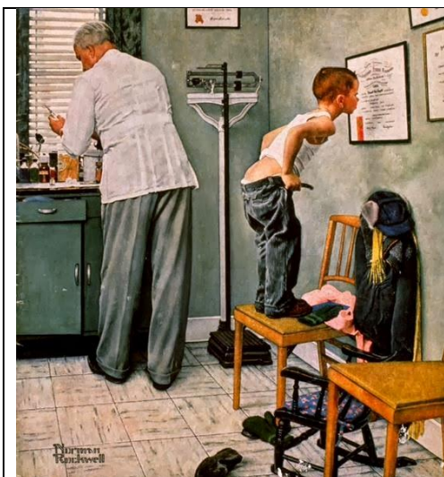
Lámina 7: "A Injeção" de Norman Rockwell" del pintor Norman Rockwell (1894-1978)

En las pinturas de las láminas 4, 5 y 6 se revela la importancia del examen físico, particularmente de la auscultación, como segunda etapa del método clínico: indagación de información mediante el interrogatorio y el examen físico.