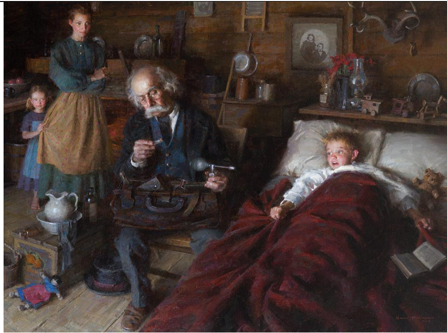
Lámina 2: "O Médico da Cidade" - Morgan Weistling

En las pinturas de las láminas 1 y 2 se revela la importancia del examen físico, particularmente de la inspección, como segunda etapa del método clínico: indagación de información mediante el interrogatorio y el examen físico.