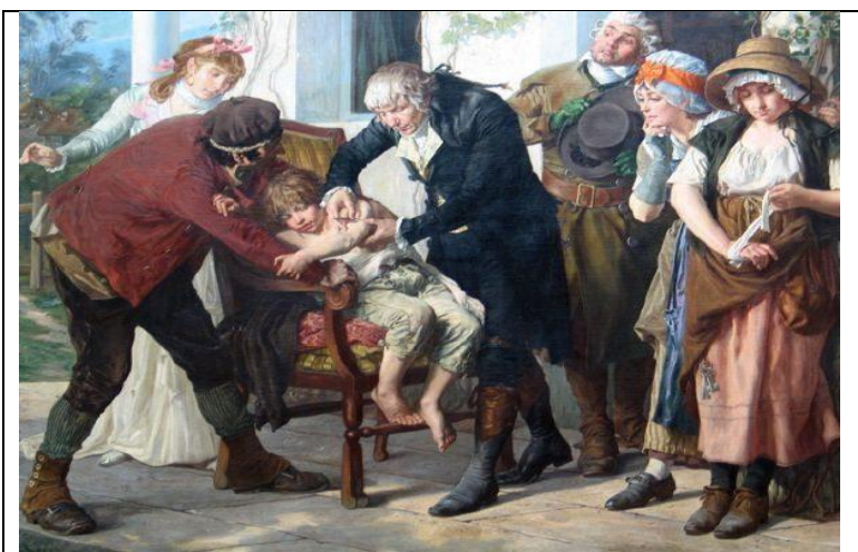
Lámina 8: Jenner inoculant la vaccine, de Gaston Mélingue. (1879)

La pintura de la lámina 8 representa una de las primeras vacunaciones realizadas por el médico inglés Edward Jenner, el 14 de mayo de 1796, contra la viruela.