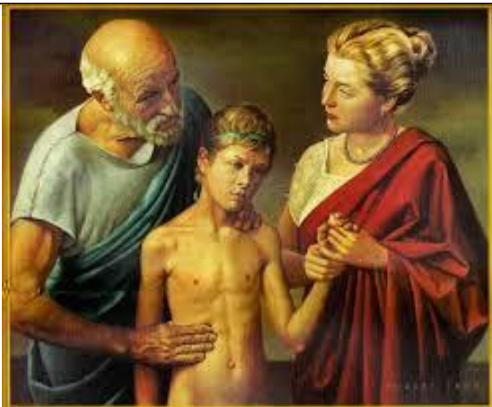
Lámina 3: Hipócrates examinando a un niño Autor: anónimo

Europeo occidental. En algunos artículos se expresa que en ciertos aspectos hubo una detención del progreso científico y algunos autores de habla inglesa se refieren a este periodo como "Edades oscuras", cuando la atención de los niños estuvo mencionada en los textos de la época pero no se conocen libros referidos a este tema.